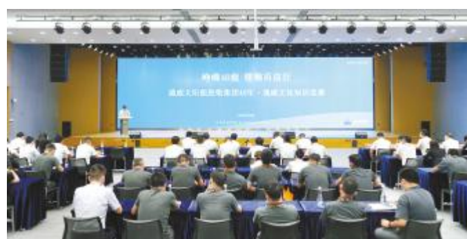
通威文化知识竞赛双流基地现场