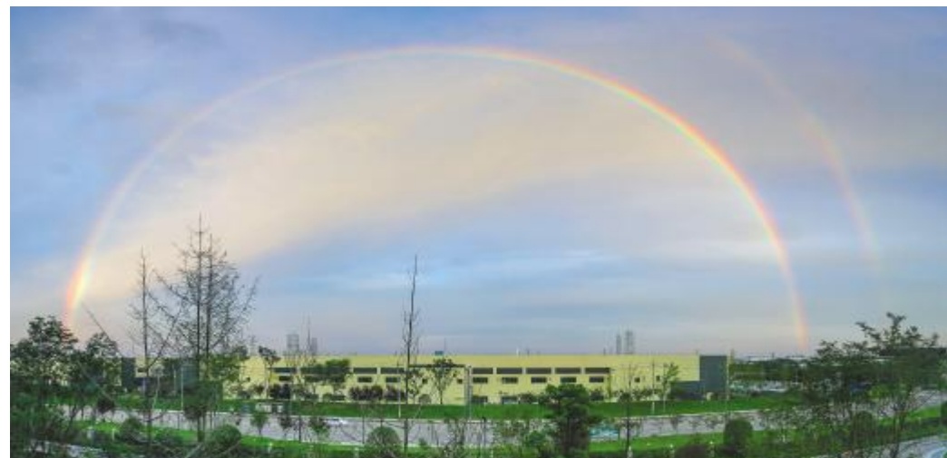
《幸运彩虹》双流基地