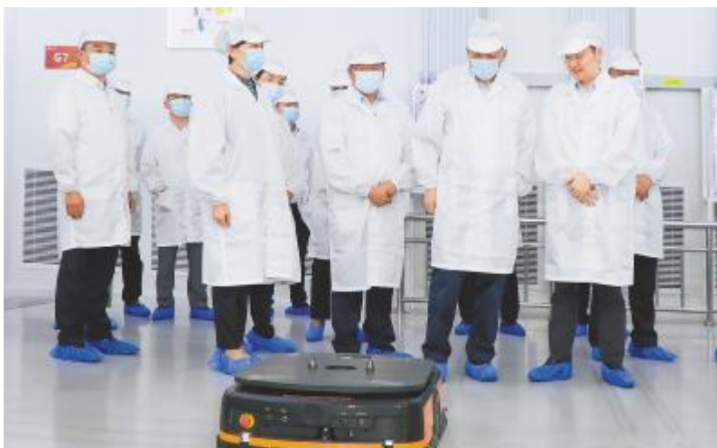
四川省检察院党组书记、检察长冯键了解通威车间智能化程度