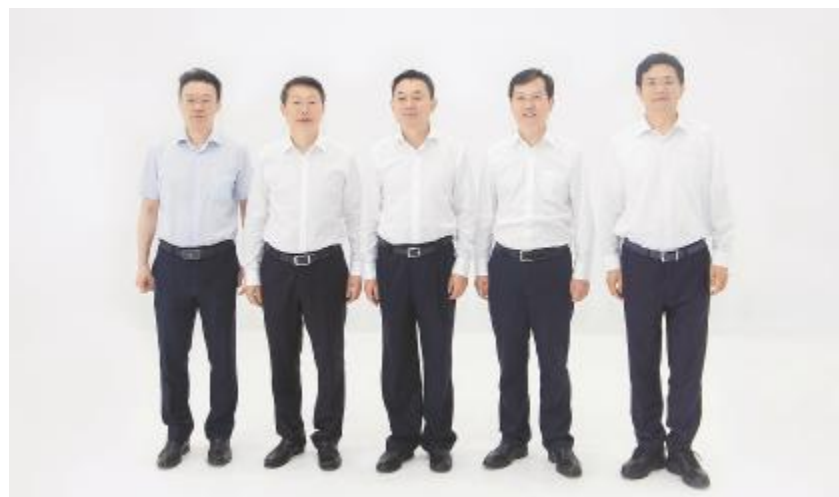
甘孜州委书记沈阳一行莅临通威太阳能调研