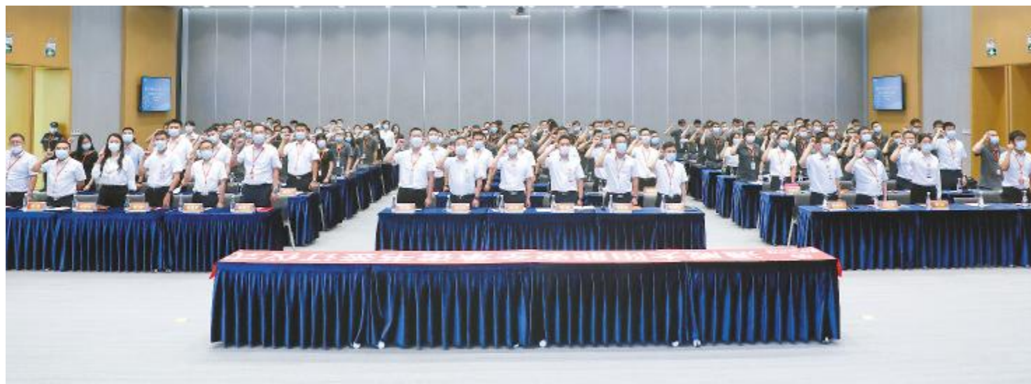
第二十八期文化沙龙暨安全承诺书签订仪式双流基地主场

2022年6月是全国第21个安全生产月,为认真贯彻落实和积极响应国务院安委会办公室、应急管理部《关于开展2022年全国“安全生产月”活动的通知》,通威太阳能以“遵守安全生产法 当好第一责任人”为主题,开展安全生产月暨第三季百日安全大作战活动。