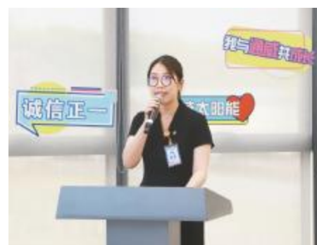
通威文化知识竞赛通合项目代表朗诵