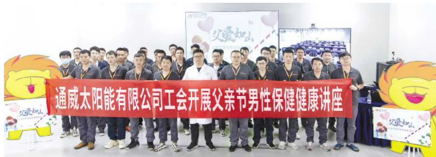
父亲节健康讲座合影留念