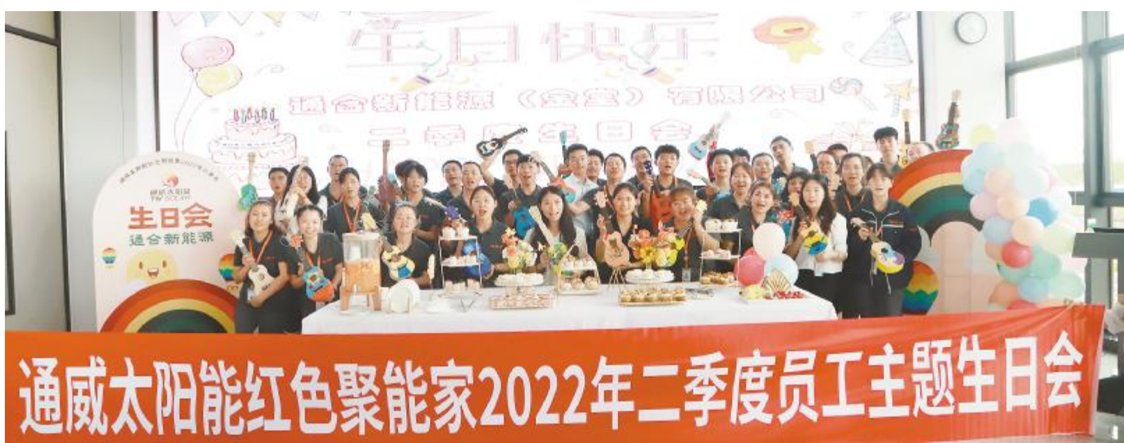
通合项目寿星代表们合影留念