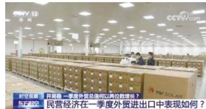
央视《东方时空》播出通威太阳能金堂基地画面