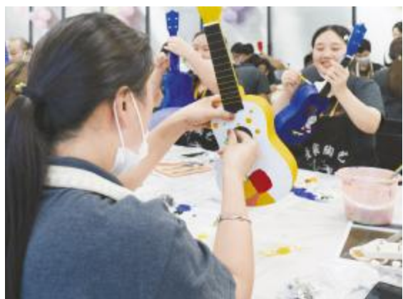
生日会尤克里里DIY现场