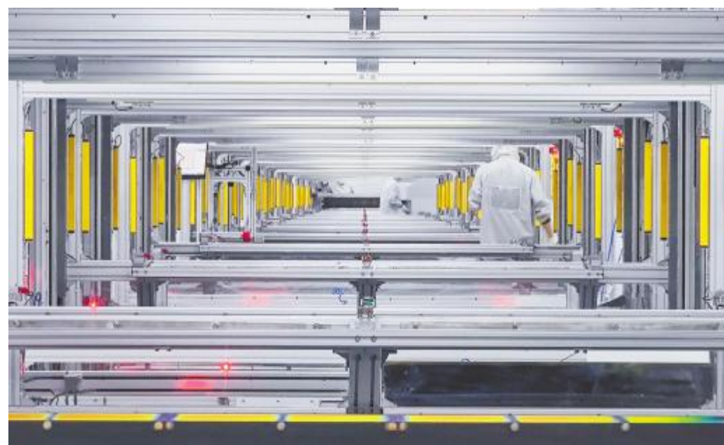
《通威日常-车间》眉山基地伊玄摄

为献礼集团40年华诞,通威太阳能组织开展“美好生活记录官·定格我的通威记忆”主题摄影比赛,广大员工踊跃参与活动。通威太阳能厂区美景、车间内员工专注工作、团队齐心协力奋战,在一线摄影高手们的镜头下定格,摄影作品一经推出,引得大家纷纷转发。本期将展出5月、6月优秀摄影作品,一起来围观吧!