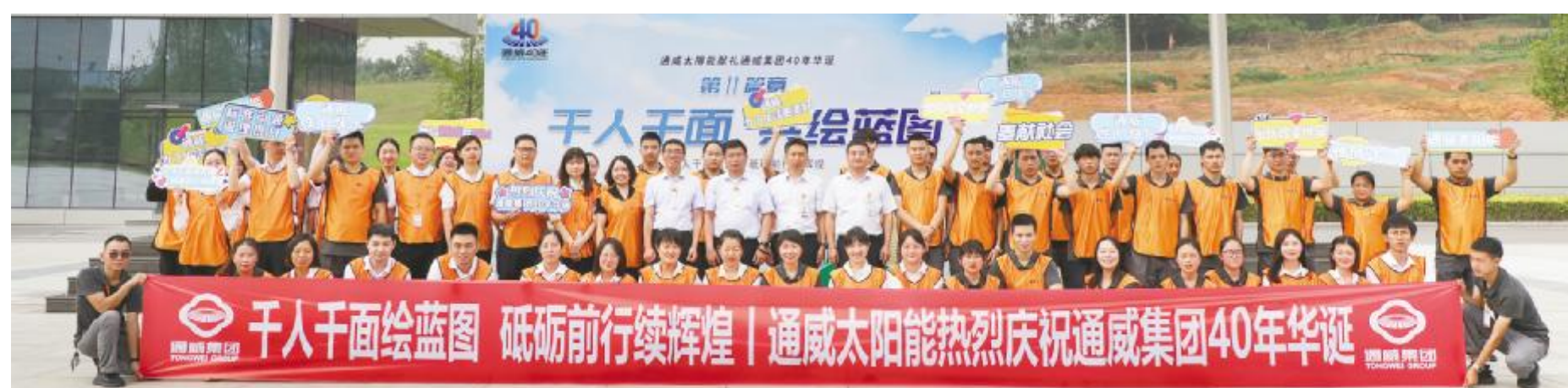
“千人千面·共绘蓝图”主题活动双流基地合影留念

千人千面绘蓝图,砥砺前行续辉煌。五个主题的巨幅画卷在员工们的共同协助下,在朗朗祝福声中一一组合舒展开来,画卷上落下的每一笔是通威人对通威四十年一路拼搏的回望,是对集团绿色农业与绿色能源双轮驱动礼赞,更是对未来通威将继续勇立潮头、踔厉奋发的美好展望。通威太阳能全体员工将继续发扬“通力合作,威力无穷”的团结协作与实干精神,用心工作,用智慧工作,用只争朝夕的精神工作,在集团的引领下在新起点新征程扬帆起航,再续华章!