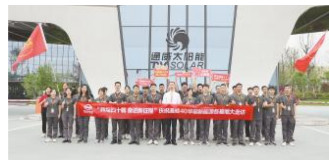
庆祝通威40年华诞新能源各基地大走访之金堂基地合影留念