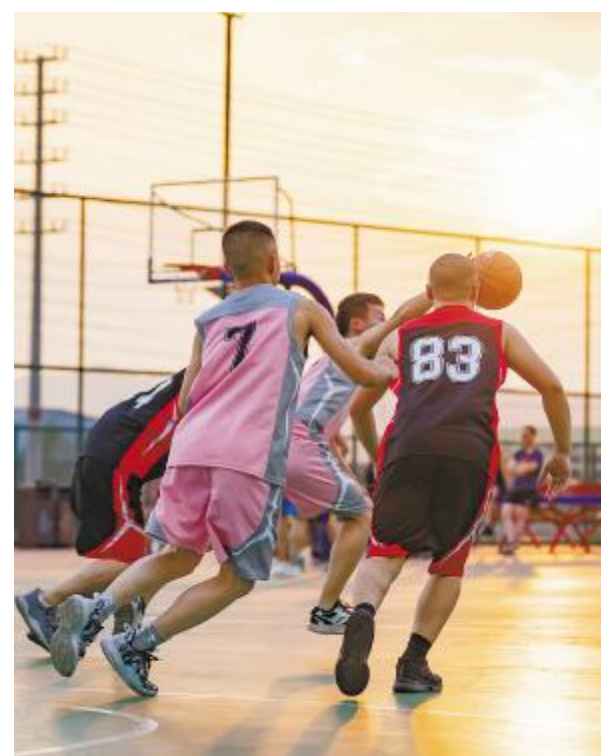
《篮球赛瞬间》金堂基地任朋摄