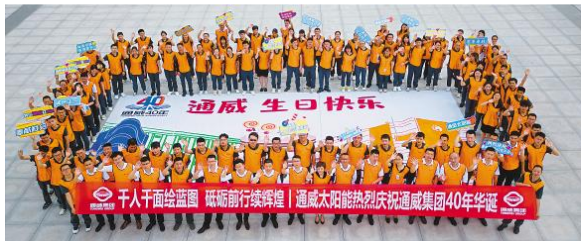
眉山基地员工代表与“通威,生日快乐”主题画卷合影留念