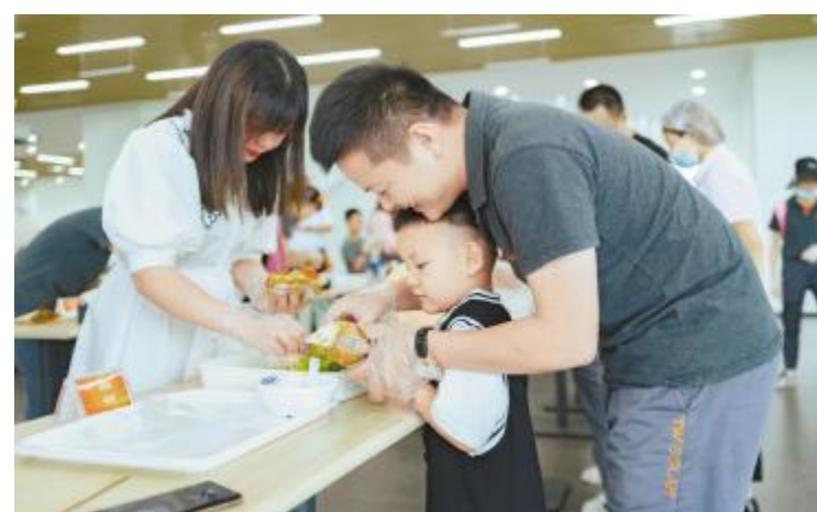
一家三口做三明治