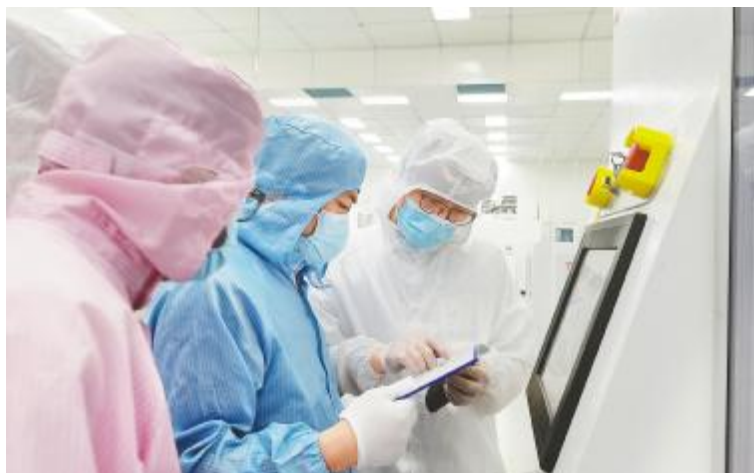
6月安全大检查金堂基地现场