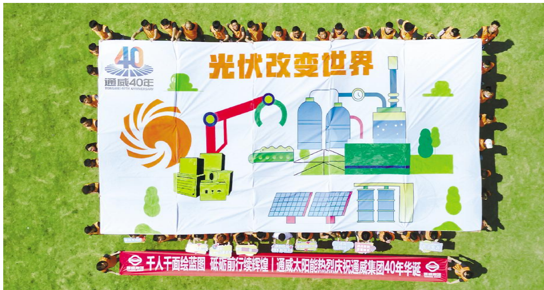
合肥基地员工代表与“光伏改变世界”主题画卷合影留念

2022年,在通威集团40年华诞之际,通威太阳能从品牌宣传、活动举办、文化建设等多维度献礼集团,增加员工对企业的认同感、自豪感,增强凝聚力。当前,通威太阳能献礼集团40年华诞活动已全面地启动,如火如荼。“千人千面·共绘蓝图”,各基地各部门千名员工进行绘画创作,齐看通威今朝融合发展之精彩,共展通威未来发展之宏图;万人重温通威文化,建设全员通力合作的文化氛围,促使通威力无穷散发;打造绿色发展的中国名片——通威太阳能电池片从这里“蓉”通全球,助力世界绿色可持续发展,为“双碳”目标早日实现贡献更多通威力量。