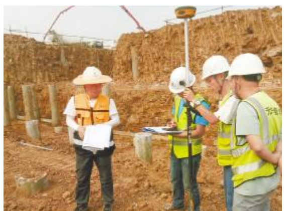
《坚守岗位》合肥基地薛磊摄