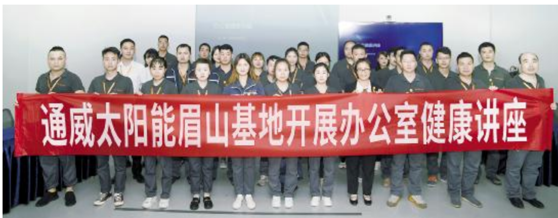
眉山基地办公室健康讲座合影留念