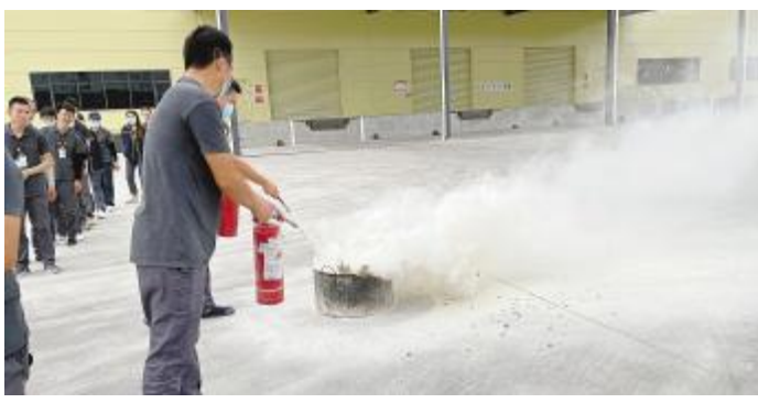
通威项目组织消防安全演习活动现场